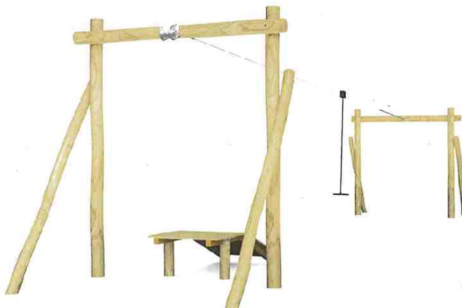
Illustration 3 : image de la tyrolienne proposée