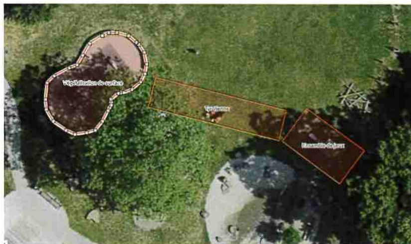
Illustration 1 : emprise au sol des différents réaménagements