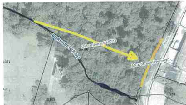
Illustration du débordement de 2023

Les autres murs sont tous en mauvais états (murs craquelés – maladie du béton) mais restent stables. Ils ne sont pas concernés par les problèmes dus à l'eau et sont tous également surveillés. Il n'y a pas d'urgence de remplacement contrairement au mur précité. En attendant de faire des travaux plus conséquents, on pourrait simplement « ajouter des planches de bois clouées ».